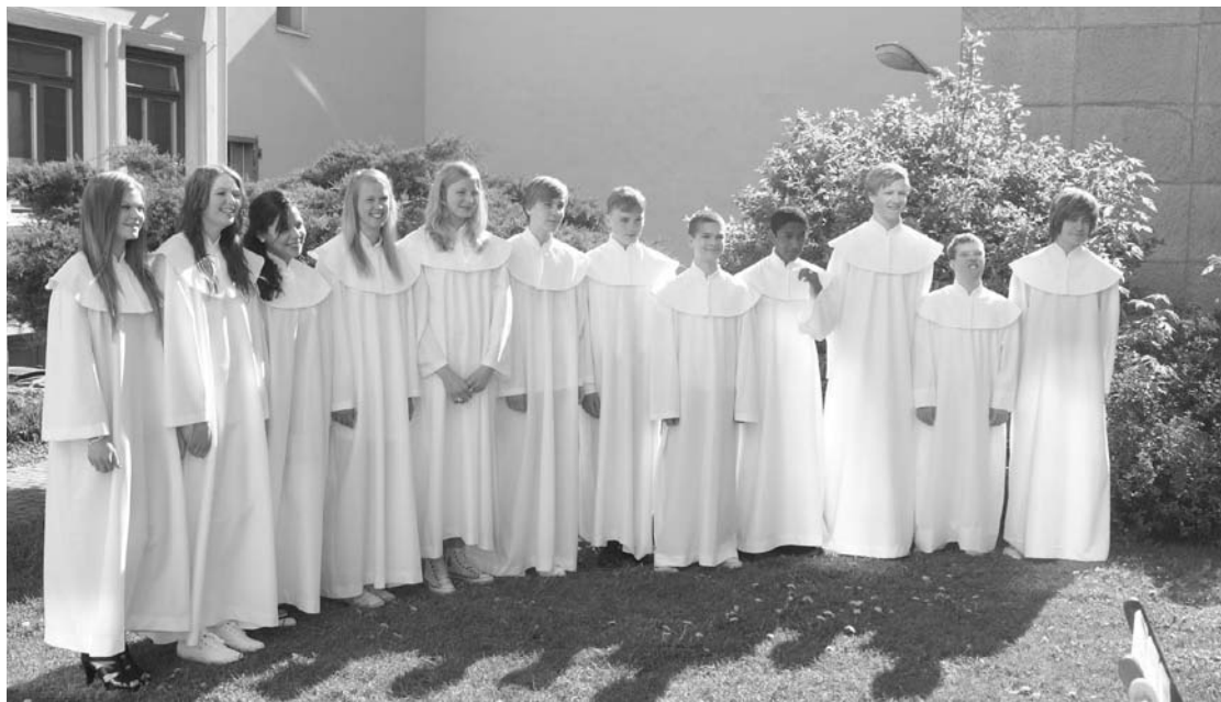
Betelkyrkans Konfirmationsgrupp 2011